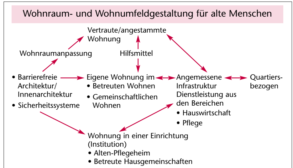
Abb. 2 Faktoren, die bei der Gestaltung des Wohnraumes und seines Umfeldes bezüglich alter Menschen zu beachten sind.

Die Anpassung der Wohnung an die geänderten körperlichen Fähigkeiten eines Menschen ist eine Voraussetzung, um zu Hause wohnen zu können (Tab. 4). Bei zunehmender Bewegungseinschränkung stellt sich die Frage, inwieweit Hilfsmittel